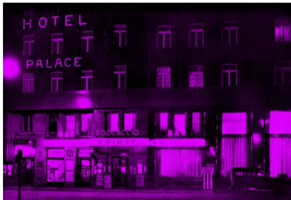
Hotel Palace (30. léta 20. století)